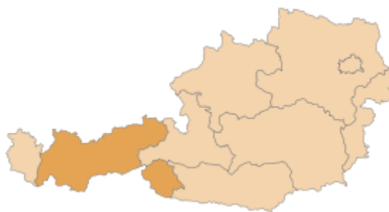
Położenie na mapie Austrii

Powierzchnia (15.5.2013 r.): 12.640 km 2 Ludność (15.5.2013 r.): 711.161 Gęstość zaludnienia (15.5.2013 r.): 56 mieszkańców/ km 2 Stolica: Innsbruck (121.329 mieszkańców- 15.5.2013 r.) Wzrost gospodarczy: (2012 r.): ok. 1,4 % Produkt Regionalny Brutto: (2012 r.) ok. 25,051 mld € Stopa bezrobocia (2013 r.): 5,3% Eksport (2012 r.): ok. 11,085 mld € Import (2012 r.): ok. 9,732 mld € Powiaty: 9 Gminy: 279