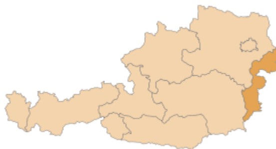
Położenie na mapie Austrii